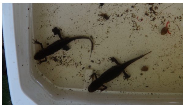
Le triton palmé